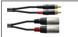
Cinch auf XLR Kabel